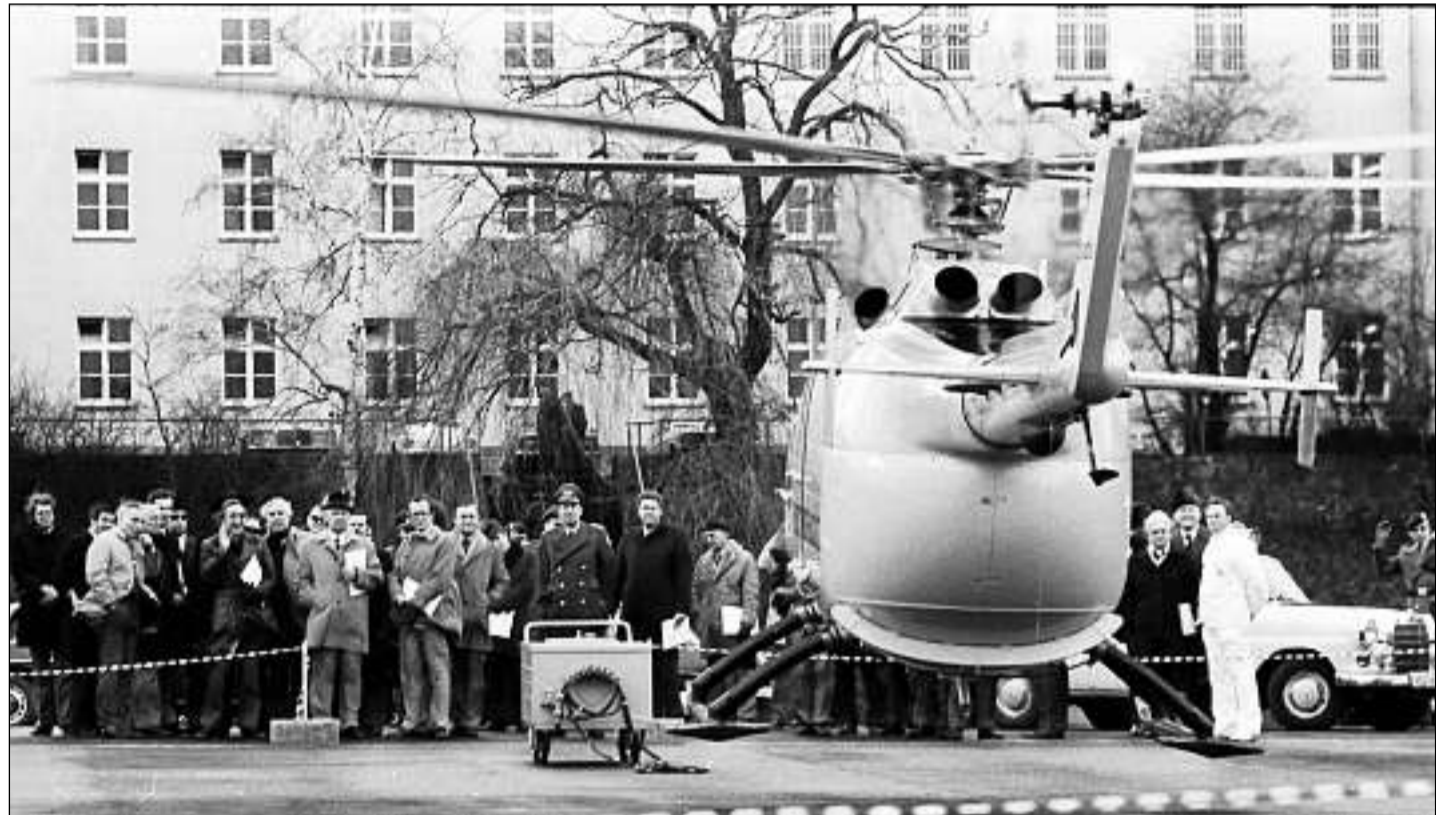
Start der Flugrettung: Noch als Christoph 9 nahm der damalige Bundesinnenminister Dr. Werner Maihofer (FDP) den Kasseler Rettungshubschrauber am 17. Dezember 1974 in Betrieb. Anfangs ging er vom Hof der Wittichkaserne aus in die Luft.