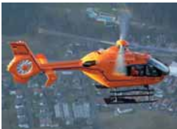
Retter in orange – Zivilschutz-Hubschrauber des Bundes

Einen wichtigen Beitrag zum gemeinsamen Hilfeleistungssystem in der Bundesrepublik Deutschland leisten die Zivilschutz-Hubschrauber des Bundes beim Einsatz in der Luftrettung.