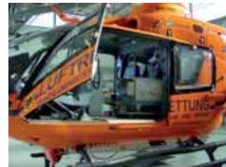
Luftretter im Einsatz

Bei schweren Unfällen und lebensbedrohenden Erkrankungen kann jeder einen Rettungshubschrauber zu Hilfe rufen. Die Alarmierung und Koordinierung erfolgt durch die jeweilige Leitstelle, die über Notruf 112 (Feuerwehr) bzw. 110 (Polizei) erreicht werden kann.